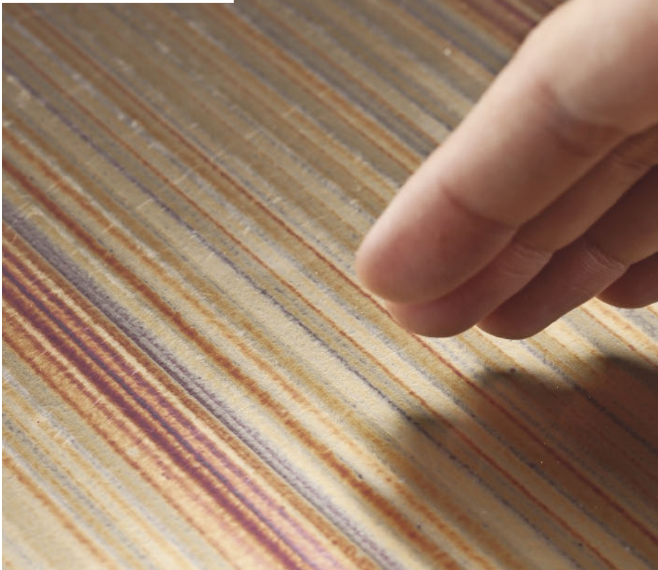
/ Dekodur's "Unique Art" HPL series is created with individually decorated copper plates. They are suitable for decorative, vertical surfaces in interior spaces.